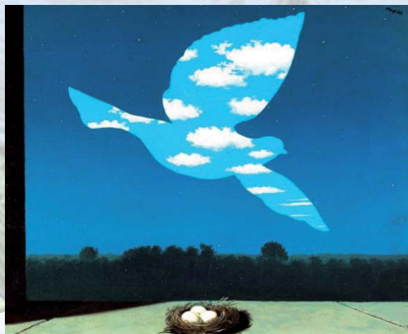
Le retour, 1940, Huile sur toile, 55 x 65 cm, Musées royaux des Beaux-Arts de Belgique, Bruxelles, © ADAGP, Paris 2008

Mistero e Natura sono i due termini che definiscono l'universo artistico di Magritte. L'artista considera il mistero lo strumento perfetto per mettere in discussione la logica dei luoghi comuni: crea sulla tela degli oggetti conosciuti trasferendoli in un contesto nuovo, insolito; mentre la natura è onnipresente nel suo percorso artistico in quanto, come sostiene egli stesso, "...ci offre lo stato di sogno che procura al nostro corpo e al nostro spirito la libertà di cui hanno assolutamente bisogno". Le parole di Magritte accompagnano il visitatore lungo il percorso espositivo: ai suoi testi, unico accompagnamento scritto, è lasciato infatti il compito di descrivere e commentare la sua opera.