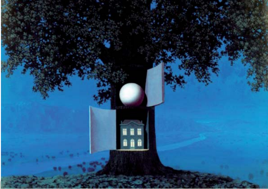
La voix du sang, 1961, Huile sur toile, 90 x 110 cm, Collection privée, Bruxelles, © René Magritte by SIAE 2008