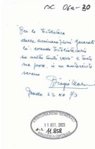
6 Dedica autografa di Biagio Marin: Per la biblioteca delle Assicurazioni Generali là, essendo bibliotecario ha scritto tanti "versi" e tante sue prose, in un ambiente sereno, Biagio Marin, Grado 22 XII 73

Il Gruppo Generali, nel 2000, si è arricchito del patrimonio librario dell'Ina, la cui biblioteca intitolata ad Antigono Donati conta anch'essa oltre 30.000 pubblicazioni in materia assicurativa (fig. 7); nel 2006 si sono ulteriormente ampliate le collezioni con il patrimonio dell'ISA (Istituto per gli Studi Assicurativi) che, nato a Trieste nel 1945, ha cessato nel 2006 la propria attività (fig. 8); negli ultimi anni inoltre sono state acquisite parte delle raccolte bibliografiche ed archivistiche del prof. Traian Sofonea, illustre studioso della materia assicurativa in tutti i suoi aspetti.