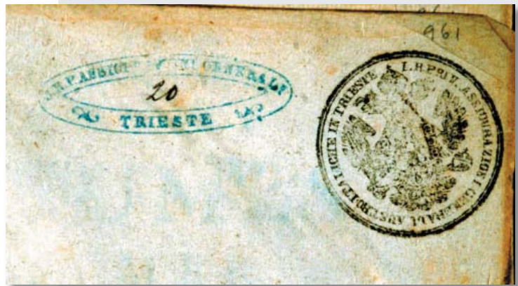
1 I primi timbri della Biblioteca della Direzione Centrale a Trieste: a destra timbro rotondo con la scritta I. R. PRIV. ASSICURAZIONI GENERALI AUSTROITALICHE IN TRIESTE (ph. C. Tommasini)