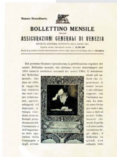
2 Bollettino mensile delle Assicurazioni Generali , numero straordinario del 1919, che riprende le pubblicazioni dopo l'interruzione bellica e dà notizia del significativo ulteriore contributo del Presidente Besso a favore della Biblioteca della Direzione Veneta da lui creata