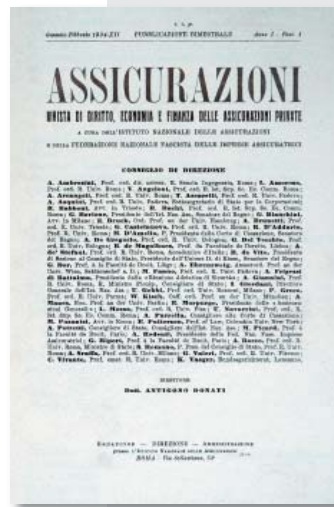
7 Assicurazioni: rivista di diritto, economia e finanza delle assicurazioni private a cura dell'Istituto Nazionale delle Assicurazioni, Roma, (1934, a. 1, n. 1)