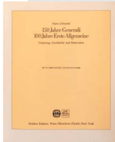
6 Volume pubblicato in occasione del 150esimo e 100esimo anniversario di fondazione rispettivamente delle Assicurazioni Generali e della compagnia viennese Erste Allgemeine Unfall und Schadenversicherung, Vienna, Molden (1982)

Oltre a celebrare i fasti dell'industria assicurativa i volumi di questa sezione parlano del mondo delle banche, della finanza, dell'industria, della ricerca scientifica e della cultura. Citiamo alcuni titoli: La Banca d'Italia, 100 anni 1893 - 1993 , 75 Jahre AEG: Allgemeine Elektrizitäts-Gesellschaft . Nel volume Il Sole nel suo centenario: cento anni dell'economia italiana 1865-1965 il Sole 24 ore, il più importante quotidiano economico nazionale, coglie l'occasione per ricapitolare attraverso le proprie colonne un secolo di vita economica e politica dell'Italia.