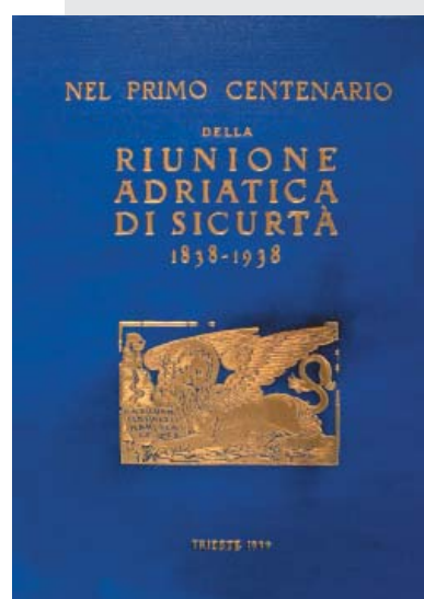
8 Nel primo centenario della Riunione Adriatica di Sicurtà (1838-1938) Trieste, la Compagnia (1939)