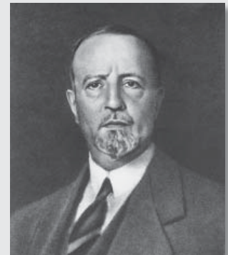
Giuseppe Volpi di Misurata (1877-1947)