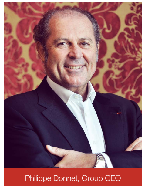
Philippe Donnet, Group CEO

Il Gruppo chiude l'esercizio 2017 con risultati economici e patrimoniali eccellenti, in linea con gli obiettivi del piano strategico che sarà completato nel 2018. Il risultato operativo di Gruppo raggiunge il livello record di € 4.895 milioni (+2,3%).