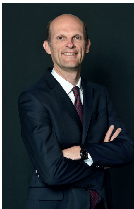
Frédéric de Courtois, General Manager Gruppo Generali

I risultati di Generali al 30 settembre 2019 vedono un ottimo risultato operativo , in crescita a € 3,9 miliardi (+9,1% vs 9M18), grazie al contributo di tutti i segmenti di business. L' utile del Gruppo sale a € 2,2 miliardi , facendo segnare un progresso del 16,6%.