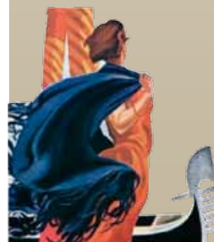
vignetta Castelli - Silver (G. Silvestri, 2010)