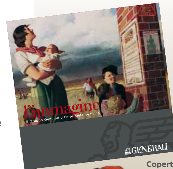
Copertina e particolare del volume