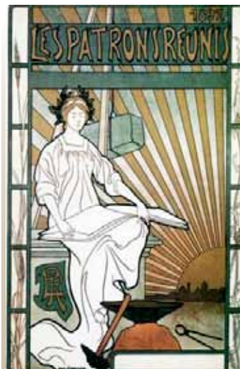
manifesto Les Patrons Réunis (P. Verdussen, 1897)

Sul sito sarà presto presente un'ulteriore sezione "storica" dedicata all'esposizione delle Generali a Roma presso il Vittoriano nell'ambito delle celebrazioni dei 150 anni d'Italia.