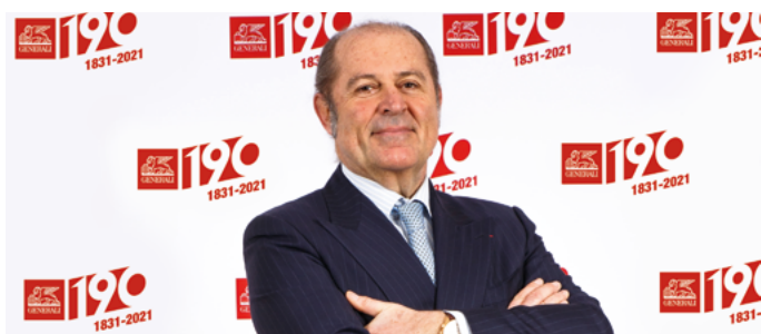
Philippe Donnet, Group CEO del Gruppo Generali

Nel 2020 Generali raggiunge un risultato operativo record e conferma un'eccellente solidità patrimoniale